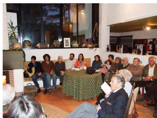
Uma fotografia de parte do grupo (à direita)